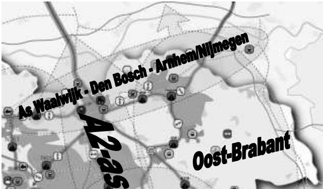
Figuur 2 Uitsnede van de kaart bij de Gebiedsagenda Brabant

In de regio Noordoost Brabant liggen drie, deels overlappende integrale gebiedsopgaven: de A2-as, de As Waalwijk – 's-Hertogenbosch – Nijmegen en het gebied Oost-Brabant. De gebiedsontwikkeling N65 maakt deel uit van de integrale gebiedsopgave Midden Brabant. Elke integrale gebiedsopgave projecten die geclusterd zijn binnen een aantal samenhangende programma's.